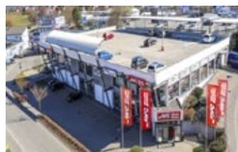
Zimmern ob Rottweil