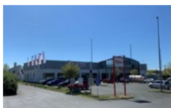
Bamberg - RingCenter